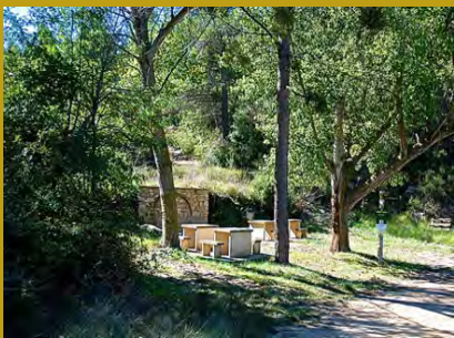
Font del Salat