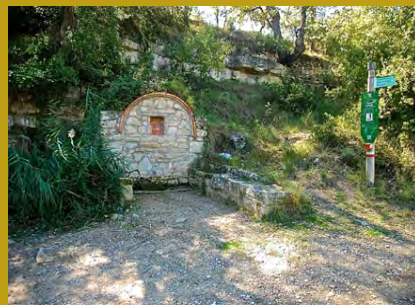
Font de la Marieta